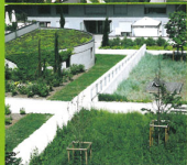
Des jardins en pleine terre en cœur d'îlot